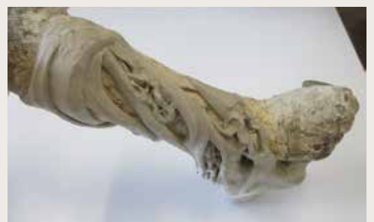
Recherches fonctionelles, tests et recherches formelles par la suite.