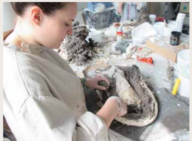
Moulage des formes, résine, plâtre, silicone.