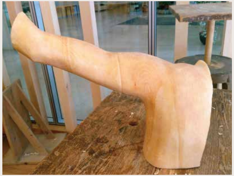
Sculpture d'une épaule, réalisée d'après un moulage.